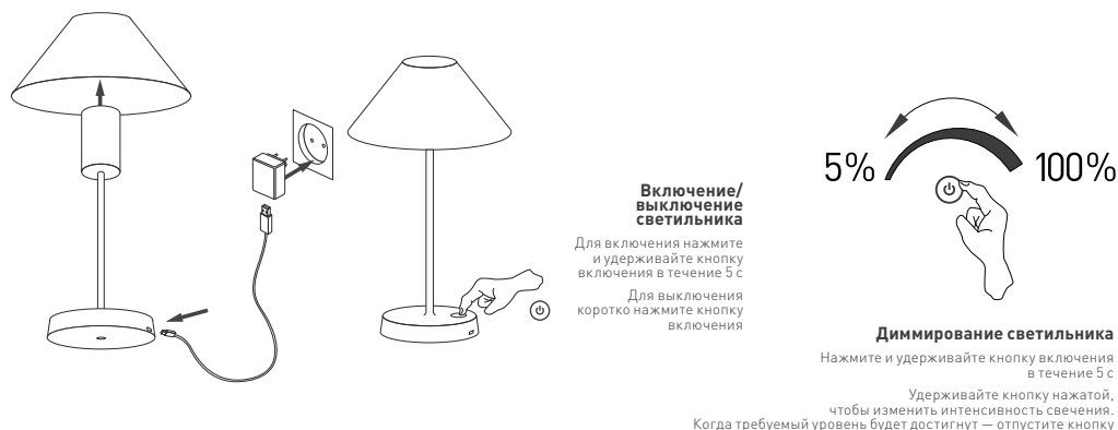
Рис. 2. Управление светильником