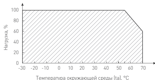
Рис. 2. Максимальная допустимая нагрузка, % от мощности источника для 35 и 100 Вт