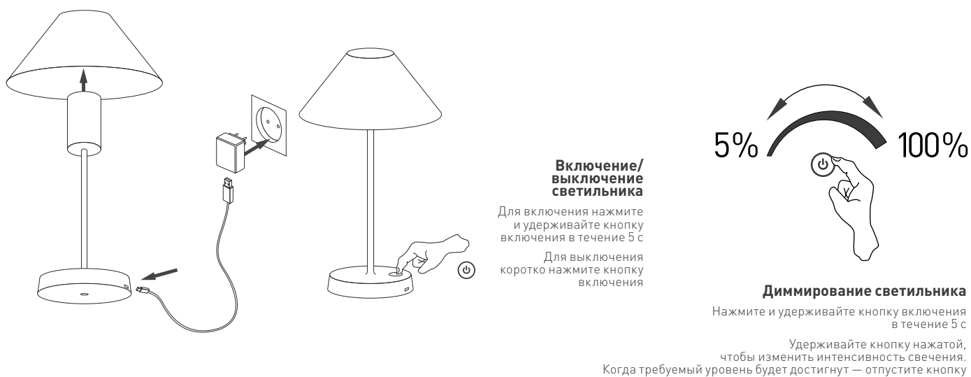
Рис. 2. Установка и подключение светильника